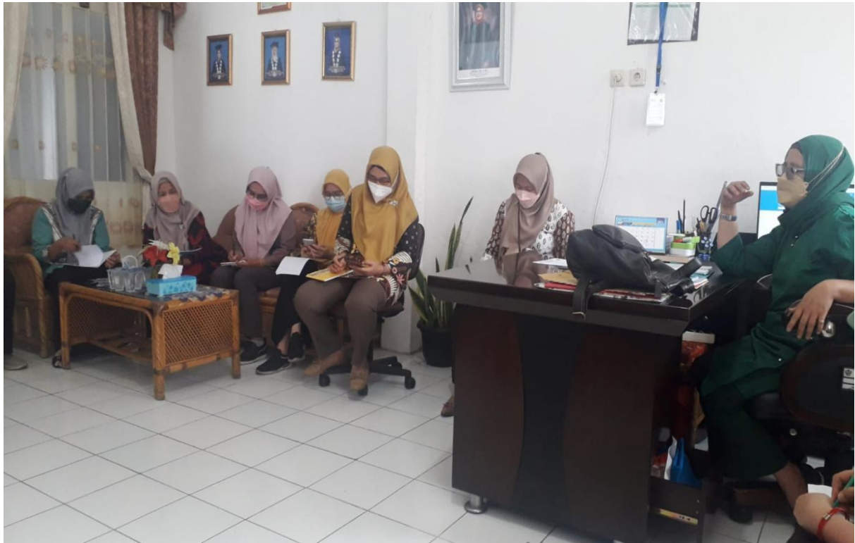
Lampiran 6. Foto Dokumentasi rapat sosialisasi pelaksanaan EDOM