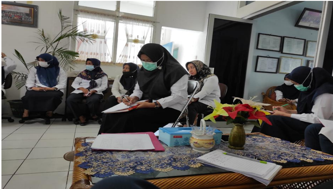
Lampiran 10. Foto dokumentasi rapat sosialisasi hasil EDOM